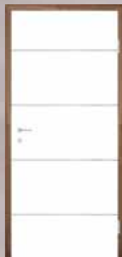
T39 5 mm