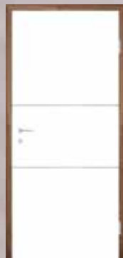
T41 5 mm