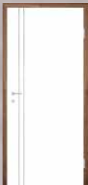
T37 5 mm